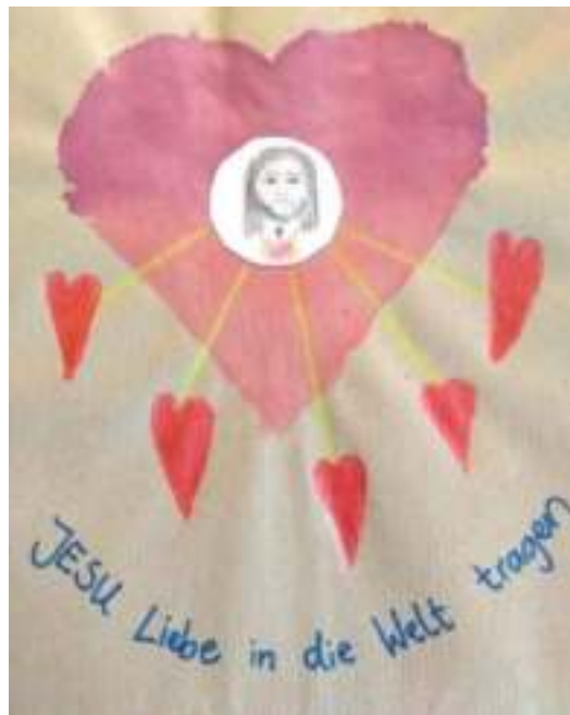
Einband: Religionsheft Lukas Rainer

Jesus, du hast Fülle mein Frieden. Ich in meine behutsam mit umgehe;