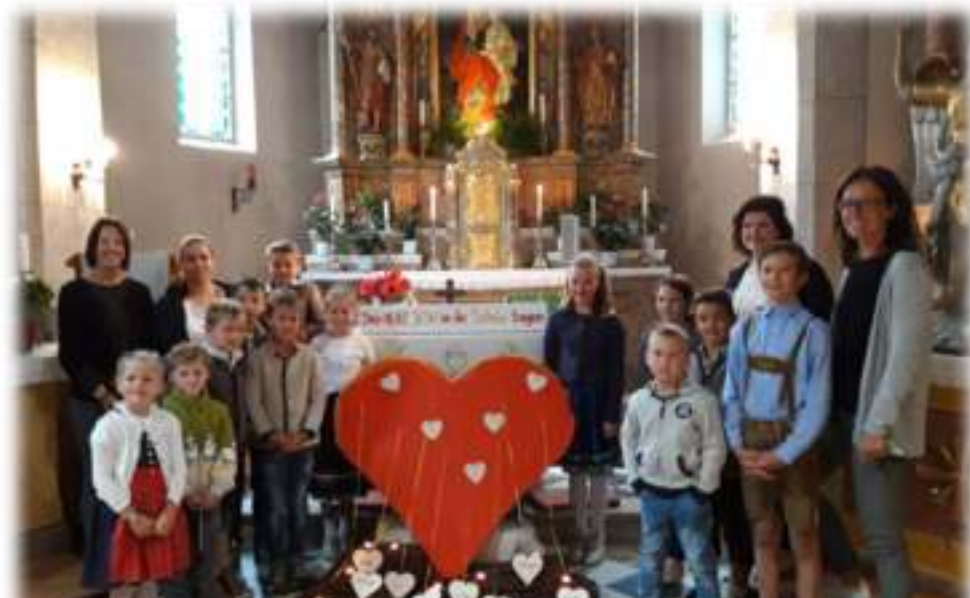
Eröffnungsgottesdienst, am 6. September 2019

Komm und schöpfe aus dem Herzen Jesu, um seine Liebe in deine Welt zu tragen.